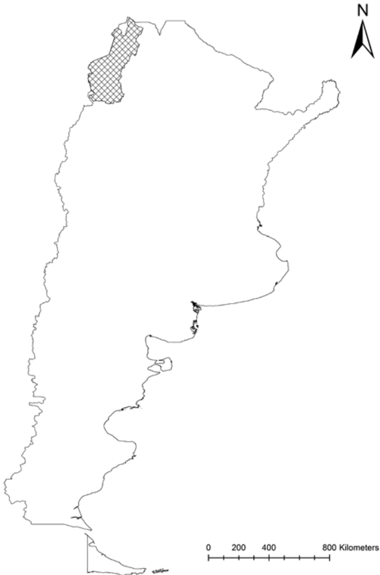
Mapa 1. Ubicación de la cuenca Cerradas de la Puna