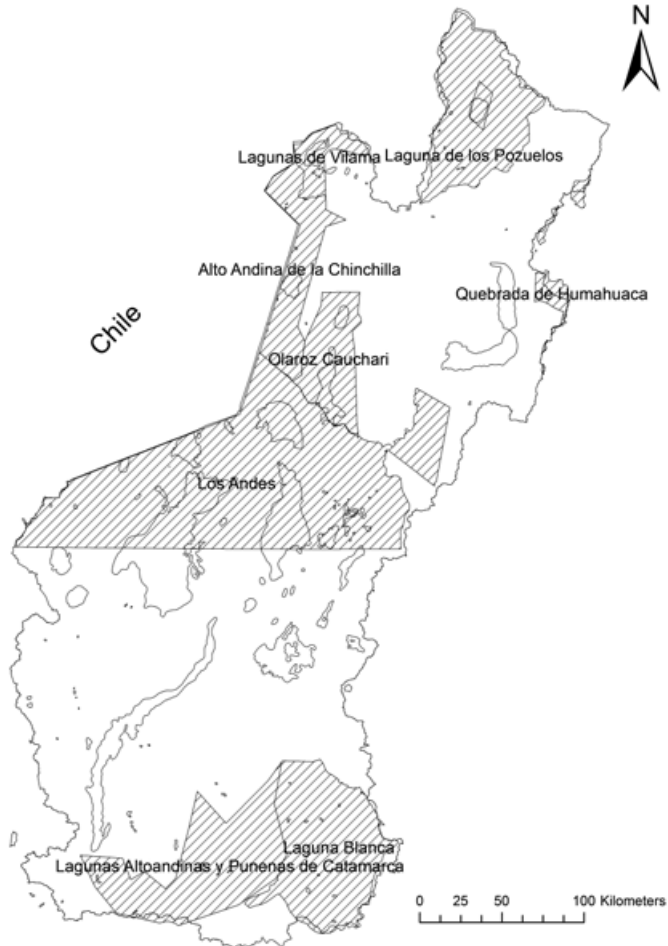
Mapa 3. Áreas protegidas de la Puna